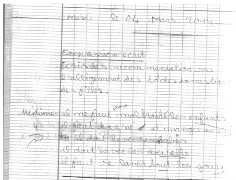
Production écrite d'apprenants de CMI de l'EPP Kami 2 ; IEP Yamoussoukro 3

Exemple Voici une production d'un apprenant sur le sujet suivant : Écris des recommandations sur l'allègement des tâches domestiques des filles.