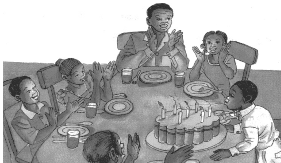
(Manuel français CE1, page 90, Collection Ecole et Nation, Editions Eburnie)

À partir de cette image, formule une consigne qui va amener les apprenants à dire ce que font les personnages.