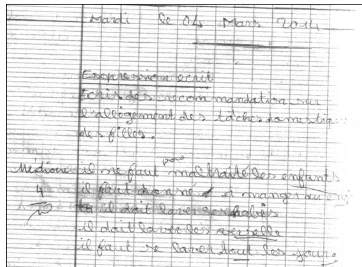
Productions écrites d'apprenants de CM1 (EPP Kami 2 – IEP Yamoussoukro 3)